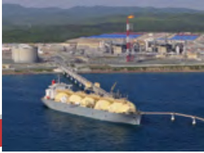
サハリンIIプロジェクト（フェーズ2）