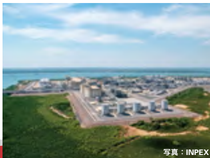
イクシスLNGプロジェクト