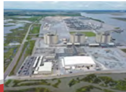
キャメロンLNGプロジェクト