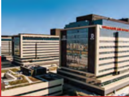
イスタンブール市イキテリ病院PPP事業