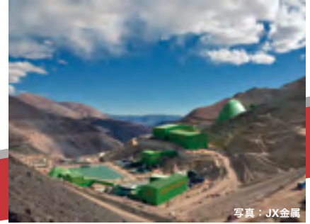
カセロネス銅鉱山開発事業