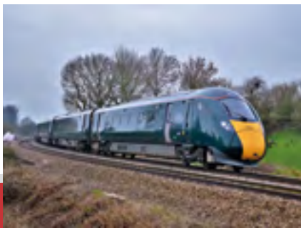
都市間高速鉄道計画 (Great Western Main Line)