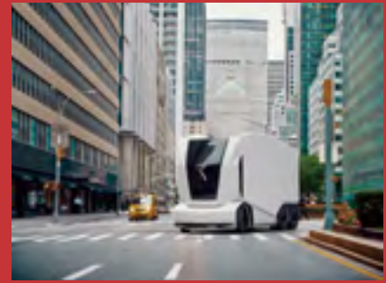
北欧・バルトファンドの投資事例 (自動運転EVトラック)