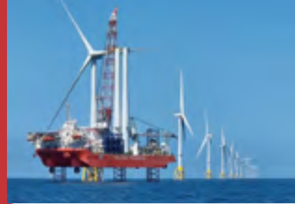
(上) 米国海外民間投資公社、豪外務貿易省及び豪連邦輸出金融保険公社との覚書調印 (下) Moray East 洋上風力発電事業