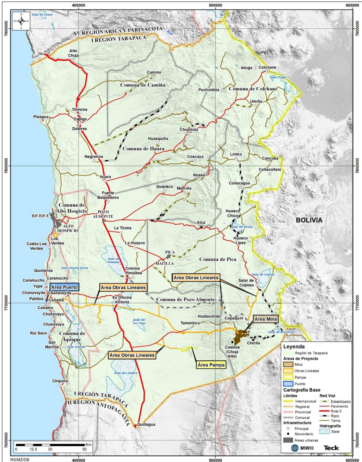
Figura 11-1. Ubicación del Proyecto a Nivel Regional.