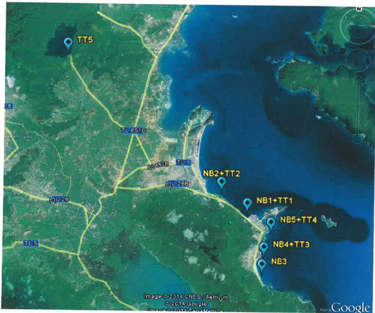
Hình 2.1.3-6 Vị trí lấy mẫu nước biển và trầm tích

Kết quả quan trắc chất lượng nước biển tháng 4/2014 được trình bày trong bảng sau.