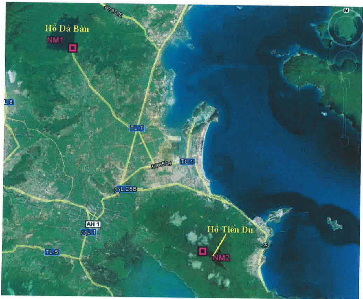
Hình 2.1.3-7 Vị trí lấy mẫu nước mặt

Kết quả quan trắc chất lượng nước mặt lục địa tháng 4/2014 được trình bày trong bảng sau.