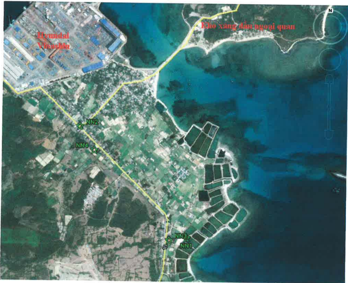
Hình 2.1.3-8 Vị trí lấy mẫu nước ngầm

Kết quả quan trắc chất lượng nước ngầm tháng 4/2014 được trình bày trong bảng sau.