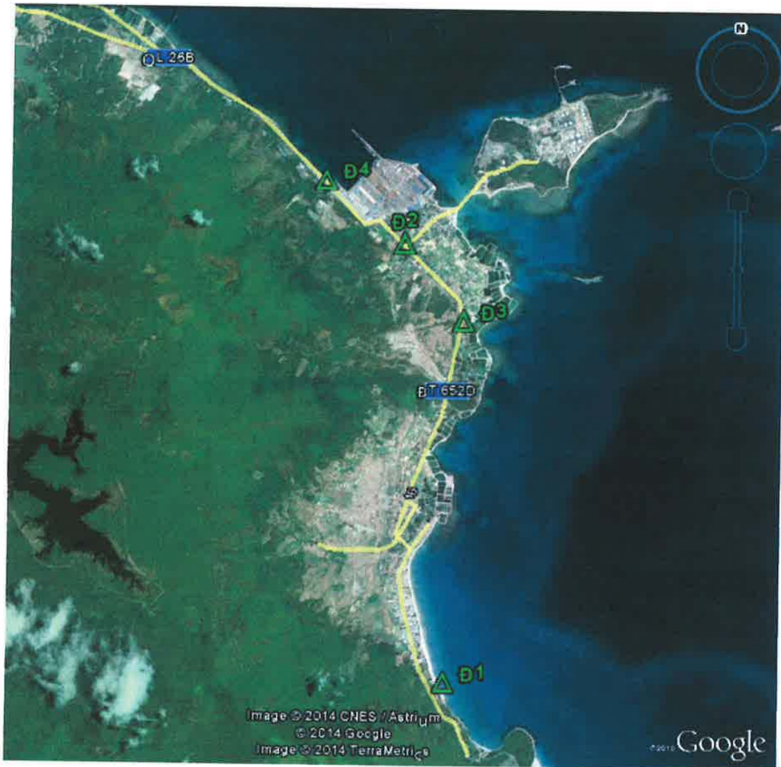
Hình 2.1.3-9 Vị trí lấy mẫu đất

Kết quả quan trắc chất lượng đất tháng 4/2014 được trình bày trong bảng sau.