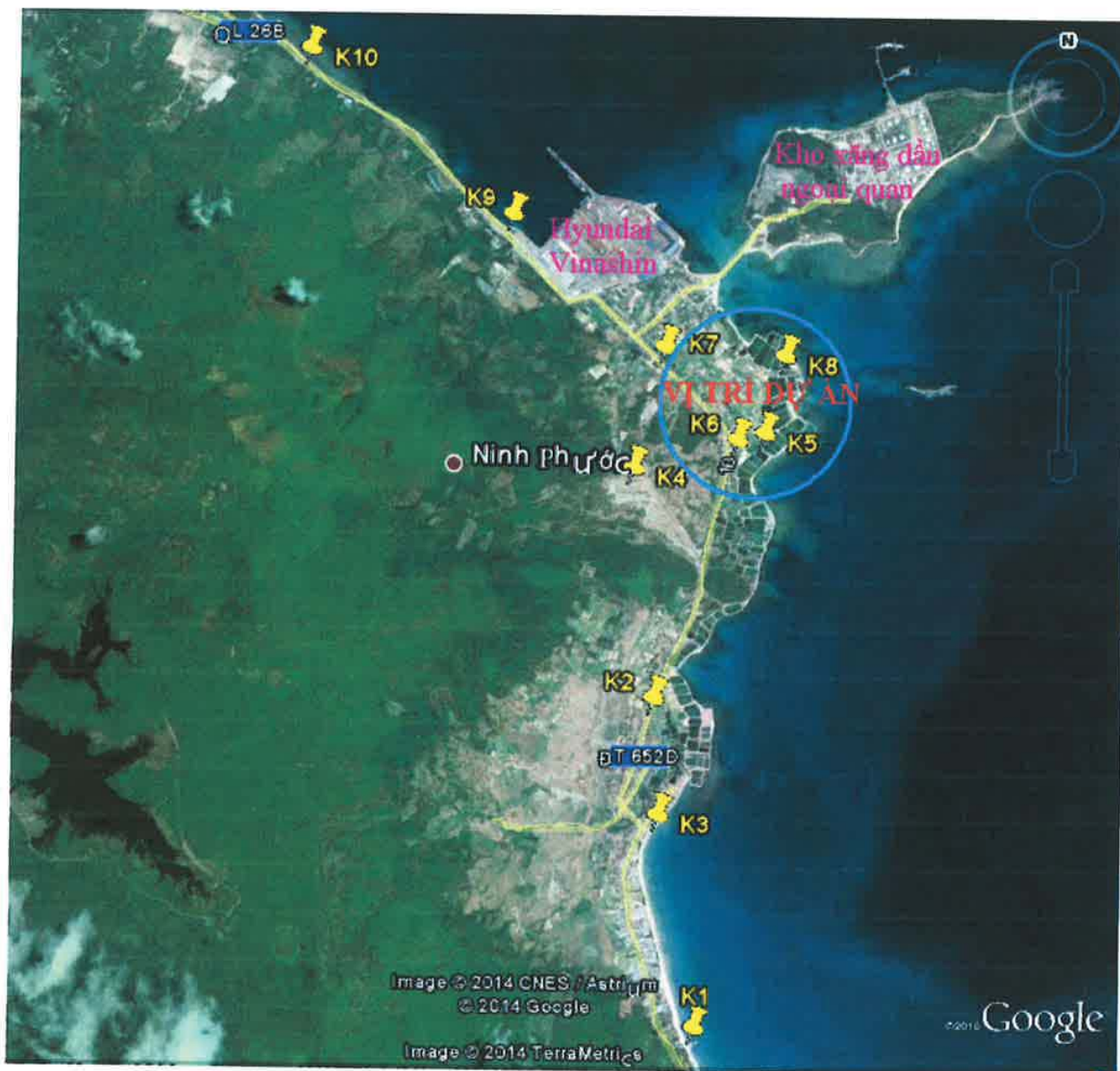
Hình 2.1.3-5 Vị trí quan trắc và lấy mẫu môi trường không khí