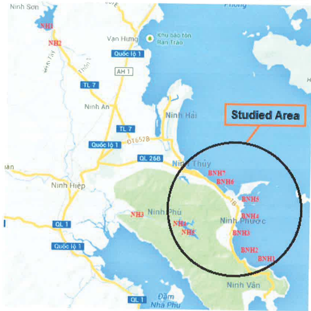
Hình 2.1.4-10. Khu vực khảo sát và vị trí lấy mẫu thủy sinh