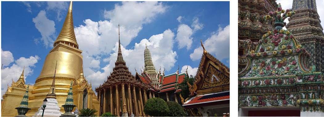
バンコク市内の寺院

仏教のほかには、イスラム教、キリスト教、ヒンズー教、シーク教、山岳民族固有の宗教もある。なお、南部4県において、2004年1月以来、分離独立を掲げるイスラム過激派によるテロが発生し、今も緊張が続いている。