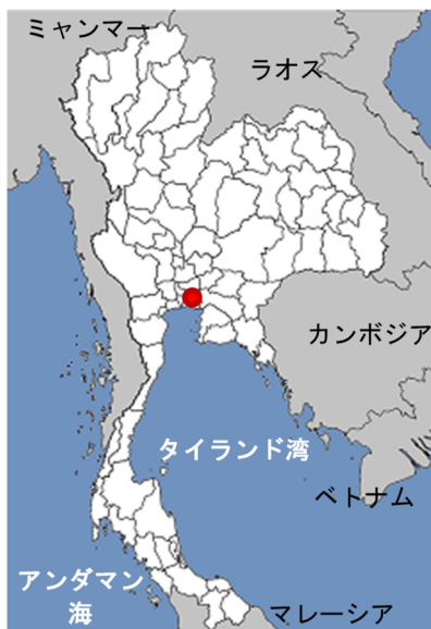
図表 1-1 タイ全図