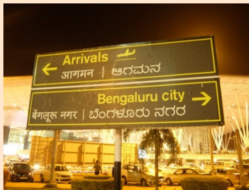
バンガロール空港の案内標識。表記上は「ベンガルール」になっている

このように民族意識が興隆する一方で、グルガオンでもバンガロールでも旧称の方が通りやすく、地元の人々も取り立てて気に留めていない様子が窺えた。