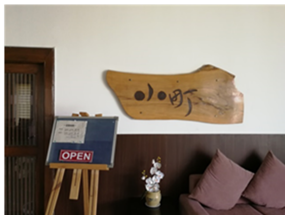
ニムラナ工業団地の標識 工業団地内の和食レストラン「小町」