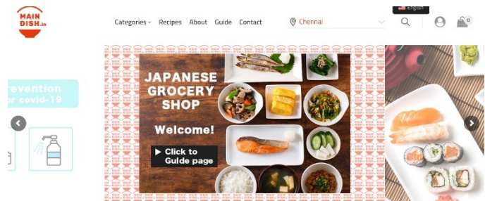
日本食材を販売している「MAIN DISH」サイト