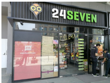
日本式のコンビニも登場