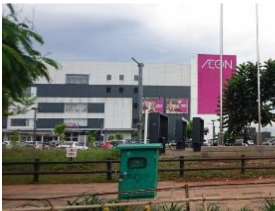
イオンモールの外観

南タンゲラン市のイオンモール内には約 140 店舗が入居するフードコートがあり、ラーメンや寿司、焼き鳥など、和食を提供する店舗も存在する。2022 年 11 月時点の同店ウェブサイトによると、「牛角」、「しゃぶしゃぶ温野菜」、「すき家」、「吉野家」、「うちの食堂」などが入っている。