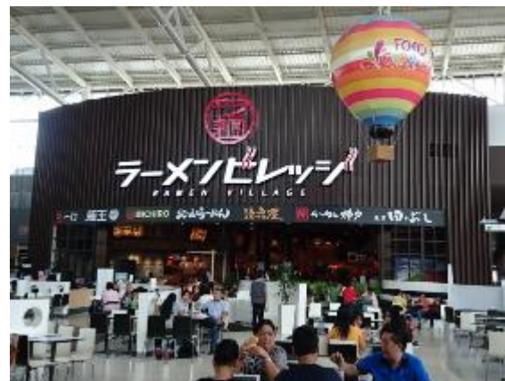
フードコート内のラーメン専門店