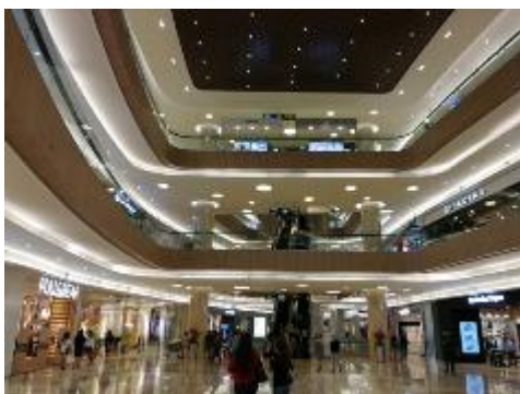
スラバヤ市内のショッピングモール

東ジャワジャパクラブがある。先述の在スラバヤ日本国総領事館のウェブサイトには東ジャワジャパクラブ作成のスラバヤガイド（医療やレストランなどの情報がまとめられている）が掲載されており、参考になる。