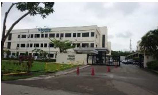
バタミンド工業団地入居企業の外観

ゴルフ場も複数あり、単身者にとっては比較的住みやすいとの声もある。ただし、インターナショナル・スクールはあるものの、日本人学校はなく、医療レベルも高いとはいえないことなどから、家族とともにバタム島に赴任する例は多くはないようである。シンガポールがすぐ近くであることから、家族はシンガポールに居住し、日本人駐在員のみ平日はバタム島に居住、週末にシンガポールに戻って家族と過ごすケースも見られるようだ。