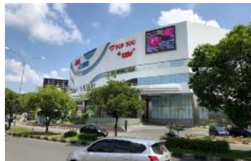
Gran Batam Mallの外観