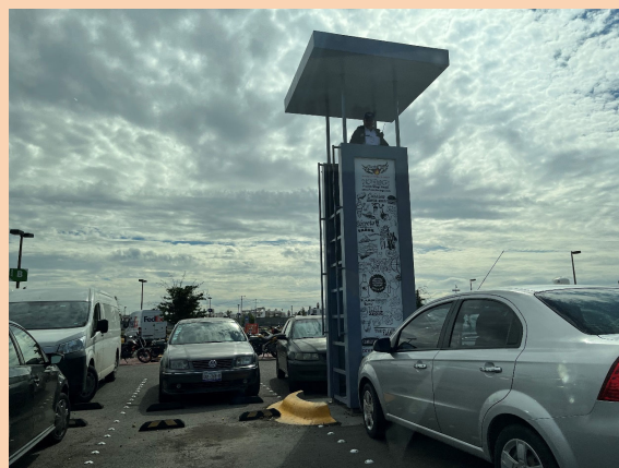
【写真説明】ショッピングモールの駐車場の監視塔

現地ヒアリングでは、上記のような最低限の対策を講じていれば、基本的に生活は問題ないとの回答が多かった。在メキシコ日本国大使館の情報によれば、2022 年の邦人被害状況を発生地域別で見ると、メキシコ市が 7 件（前年比 5 件減）、グアナファト州が 12 件（前年比 2 件増）で、両地域における被害が全体の 6 割以上を占めている。