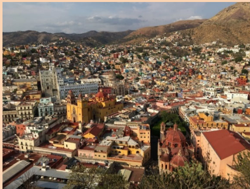
【写真説明】グアナファト市ピピラの丘からの風景

一方で、現地ヒアリングでは、レオンでは麻薬カルテル関連で毎日何かしらの事件が発生しているため、夜は出歩かない方が良いだろう。