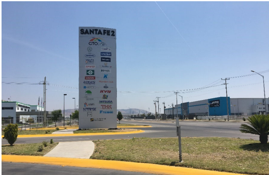
現地工業団地の様子