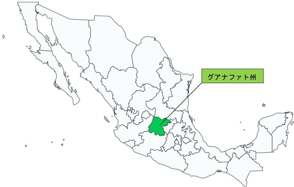
図表 26-2 グアナファト州の位置