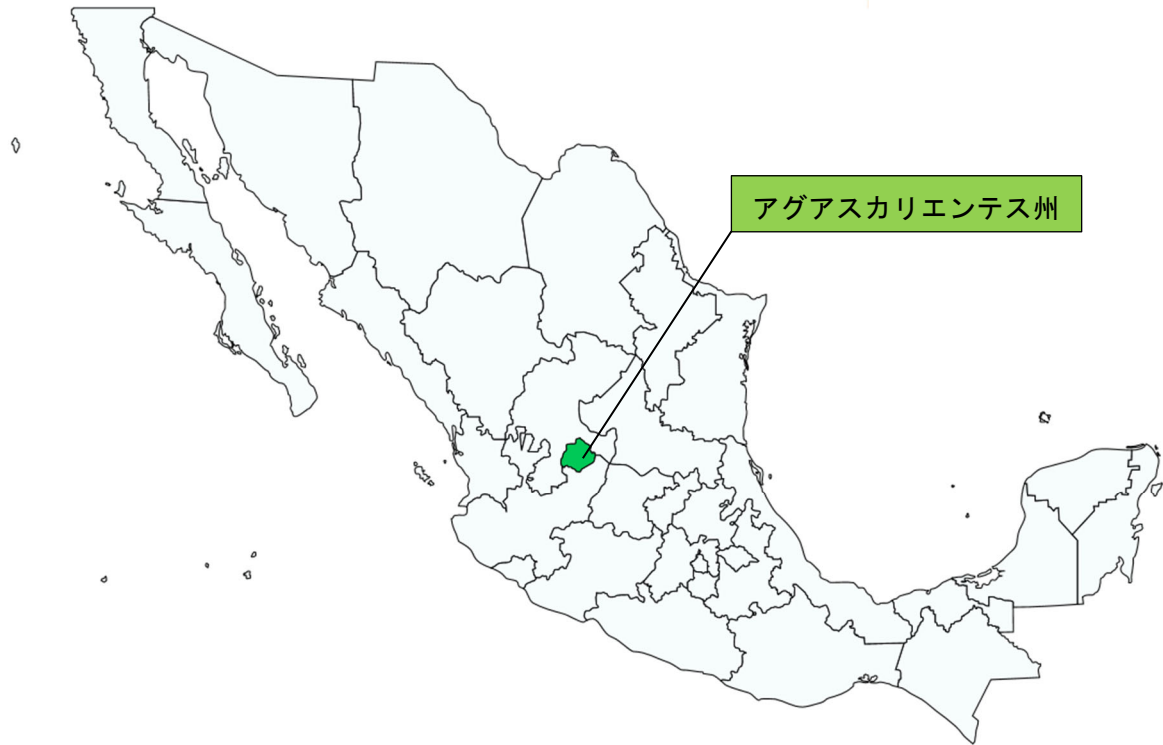
図表 27-2 アグアスカリエンテス州の位置