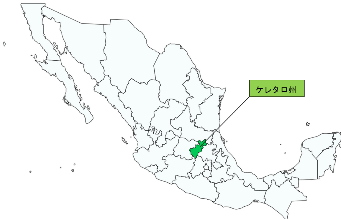
図表 28-2 ケレタロ州の位置