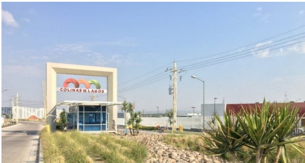
現地工業団地の様子