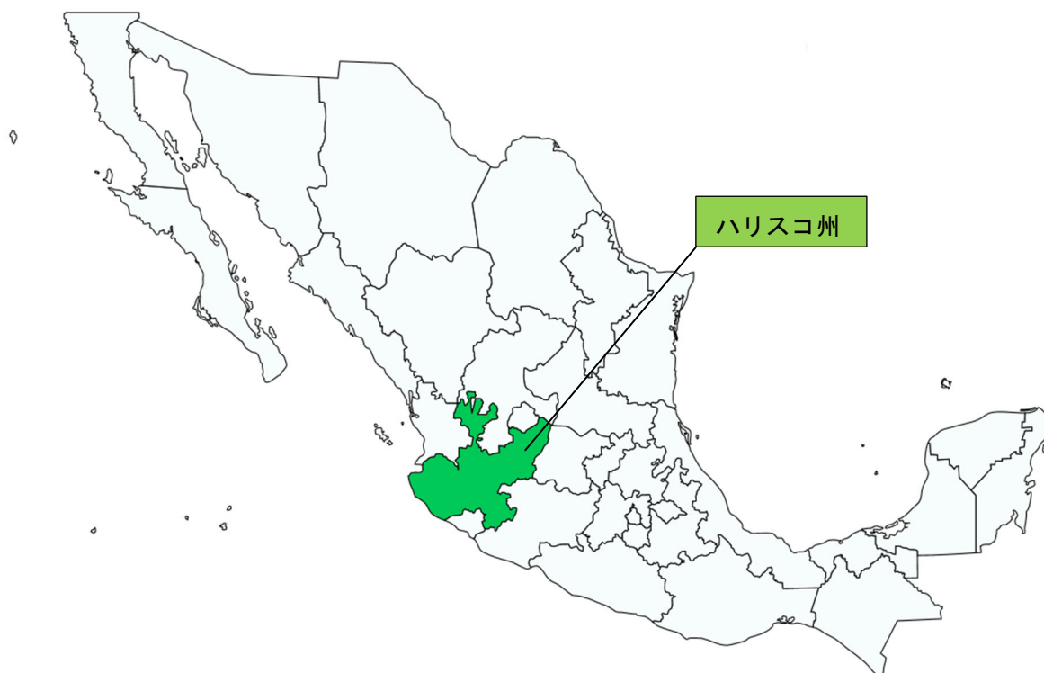
図表 31-2 ハリスコ州の位置