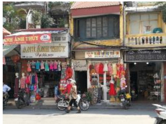
ハノイ市内の景観（左）と街中の雑貨店（右）