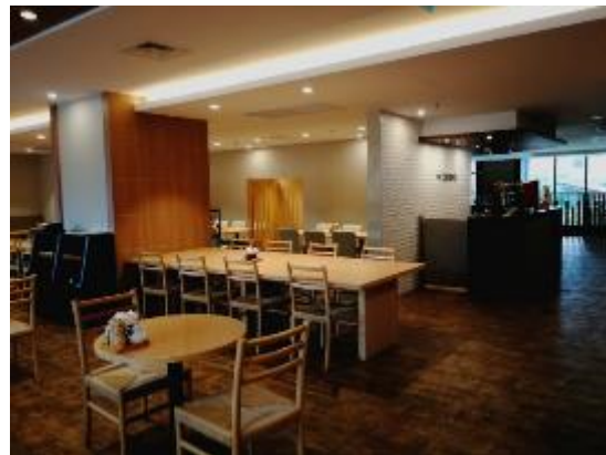
上段左：ハノイ市内のショッピングセンター、上段右：工業団地内の食堂の定食メニュー 下段：日系サービスアパートメントの居室内（左）と食堂（右）（出所：大和ハウス工業）

ハノイでは、2015年11月にイオンモール・ロンビエンが開業し、2019年には二つめのモールであり、ベトナム最大面積であるイオンモール・ハドンが開業した。ハノイ市初出店となるスターバックスコーヒーや、日本食を扱うデリカ売り場などがある。その他、ユニマート（旧・西友）や、韓国の Lotte Mart、タイ資本の Big C と Metro、地場 Vinmart などのスーパーマーケットがある。地場系の FIVIMART 及び Citimart はイオンと提携しており、イオンの PB 商品「トップバリュ」を購入できる。日系コンビニエンスストアはハノイにはサークル K が出店している。また、地場の Shop&Go や Vinmart、個人経営の商店が多くある。また、有機野菜や安心・安全野菜などを取り扱う事業者がおり、日系の宅配サービスも利用可能となっている。日本食レストランは、ラーメンから寿司、焼肉など幅広い種類が存在している。特に、日本食レストランは日本国大使館が立地する Kim Ma エリアに多い。また、各国料理のレストランもあり、ホーチミンほどではないが食生活におけるバラエティに富んできている。Grab Food といったフードデリバリーアプリも活用できる。生活用品については、ダイソーや無印良品も進出している。