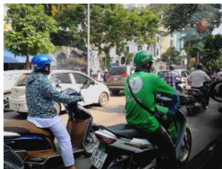
ハノイ市街地を走る Grab（バイクの配車サービス）の運転手

ハイフォンでは、現地調査において、バス網の未整備を指摘する声が聞かれた。市内のバス網は整備されているが、工業団地が立地するエリアはバス交通自体が存在しないため社員がバイク通勤せざるを得ず、そのため交通事故に遭うことが多いという。港湾の近くの工業団地では大型トラックの交通が頻繁であり、バイク通勤に危険を伴うことから、自社で通勤バスを用意している会社もある。