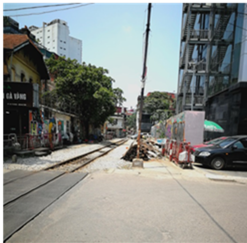
ハノイの街中を走る線路

この他、近年、ハノイでは都市鉄道計画が進められている。1 号線、2 号線は日本の円借款により建設され、2A 号線は中国、3 号線はフランスの支援により建設が進められている。2A 号線は 2011 年に着工して以来、開業計画を幾度も延期していたが、2021 年 11 月に開通した。