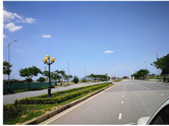
ダナン市内の IT パーク