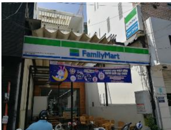
ホーチミン市内のファミリーマート

食事の面では、好みにもよるが、概して日本人には合うという声が多く聞かれた。周辺国の料理と比較すると、ベトナム料理は中華料理よりあっさりしており、タイよりも甘辛くなく、パクチーなどの香草も他国よりも多くないという。また、商業施設の増加により日本食レストランも増加しており、現地調査では「だいたい日本食を食べている」という駐在員を多く見かけた。日本食材は、イオンやファミリーマート、ミニストップなど日系小売店や、日本食材専門店などで入手できる。イオンが提携する Citimart では、トップバリュの商品が売られている。野菜をはじめとした安心安全な食材や、弁当の宅配サービスも利用可能である。