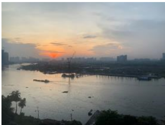
市内を流れるサイゴン川

ホーチミンは、ベトナム最大の商工業都市であるだけでなく、都市ベースで最大の人口 860 万人 (2018 年) を擁し、かつ、ベトナムの中で最も経済基盤が整備されてきた都市である。立地や整備されたインフラなどを背景に日系企業の約 6 割がホーチミン近郊に進出しており、海外投資家からの人気も高い。2020 年のホーチミン市の 1 人あたり月収は約 597 万ドンと、他地域と比較して既に一段階高い水準にある。所得水準の高さから、ホーチミンは消費市場としての魅力が今後も一層高まると期待される一方、労賃上昇、労働力不足、進出余地 (土地) の供給不足も顕在化しており、コスト高になりつつある点が懸念されている。