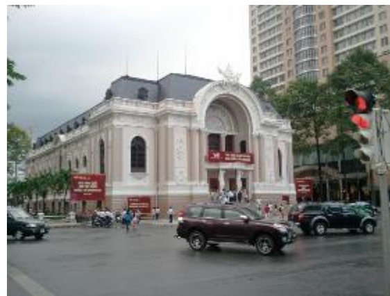
ホーチミン市民劇場 (オペラハウス)