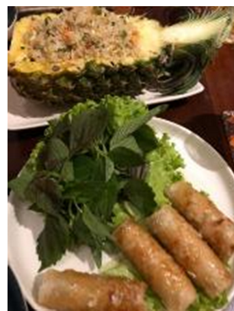
日本人好みの料理を提供する レストランも多い

南部の娯楽は、ゴルフ、プール、テニス、フィットネスクラブ、サッカー、ラグビー、ダイビング、カラオケなど幅広く楽しめる。日本人コミュニティを中心とした各種クラブ活動も盛んである。また、子女向けに遊園地やウォーターパーク、動物園といったアトラクションも多く立地する。ショッピングセンターにも室内遊園地が併設されている。施設面で日本のショッピングセンターに匹敵する水準のショッピングセンターが増加しているが、日本人への訴求力は高くない。その一因として、ベトナムは贅沢品に対する関税及び税金が高率であり、輸入された日本品は手を出しにくい価格設定であることが挙げられる。